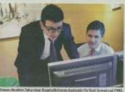
Styrelsen i Rabee Securities.